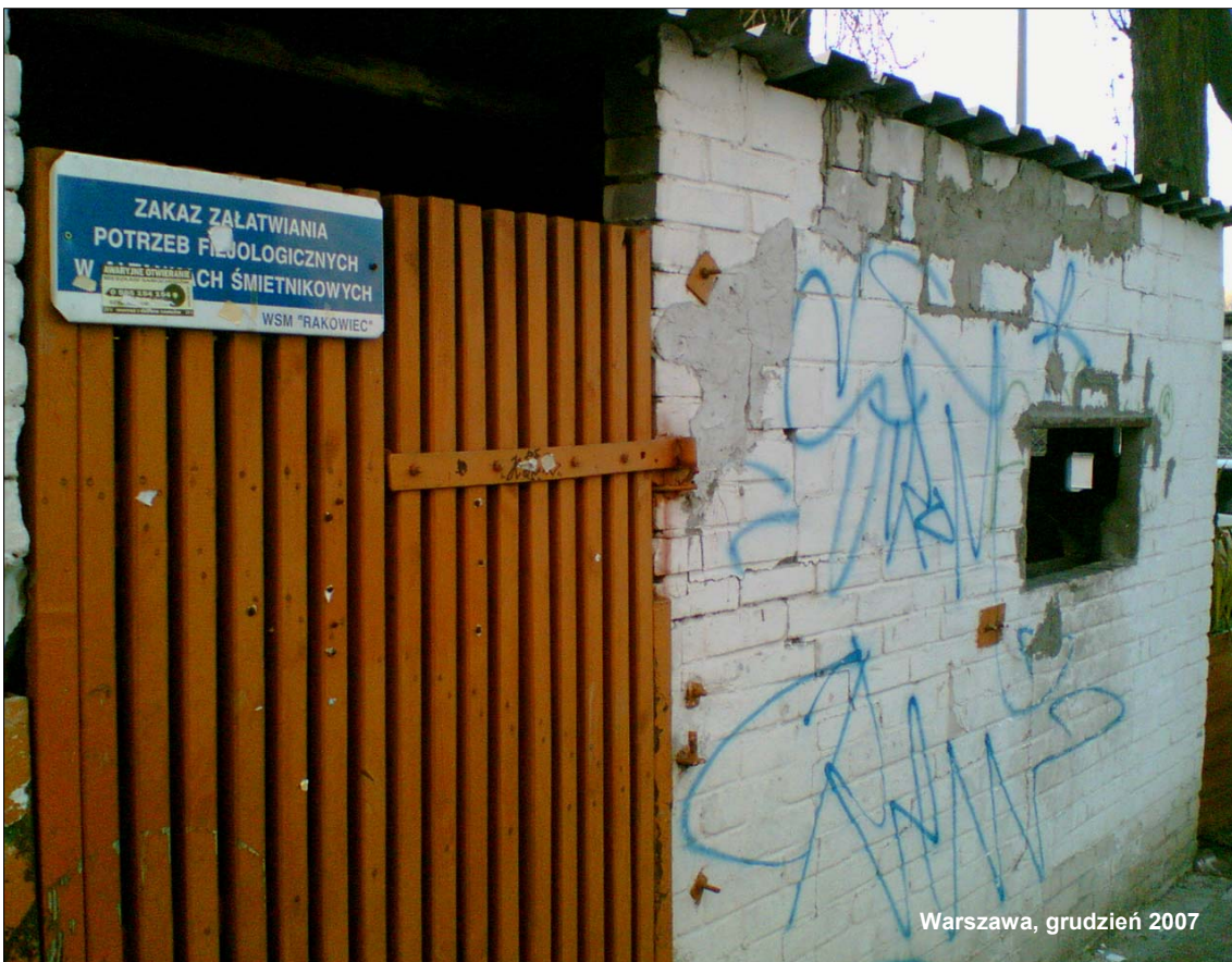
Warszawa, grudzień 2007