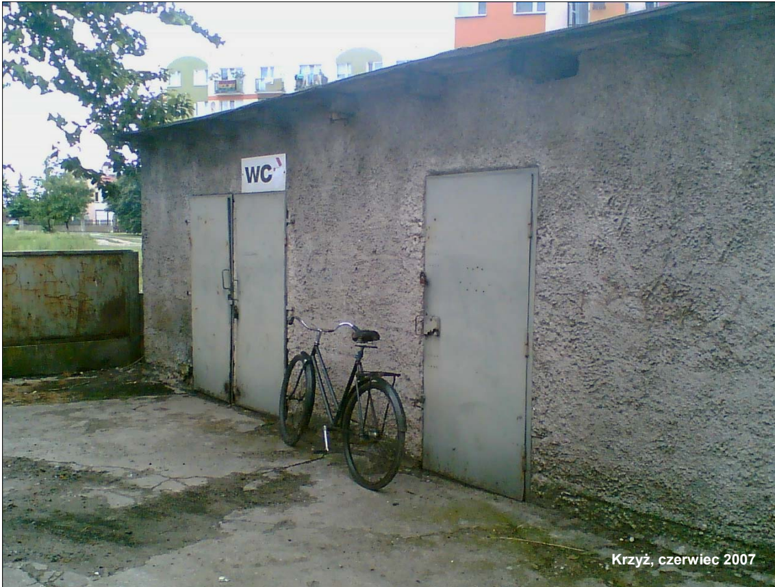
Krzyż, czerwiec 2007