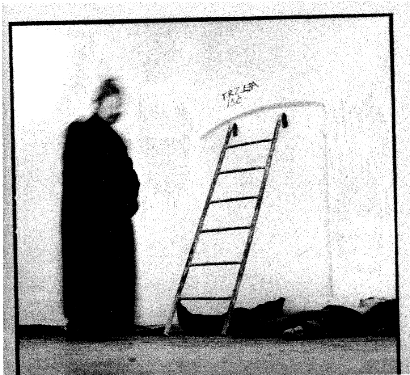
Łódź Kaliska, akcja

numer sztuczny lipiec 2006 statystykę zwiększający [...]