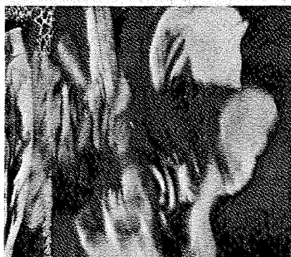
bt 41 – projekt ironia montaż (nie pytajcie: po co?): dast